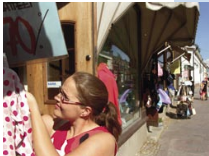
Kuninkaankatu on jo saanut uuden ilmeen, Kauppakadun peruskunnostus valmistuu ensi kesänä.

Keskustan kehittämishankkeiden etenemistä voi seurata netissä ( www.rauma.fi ) teknisen viraston sivuilla.