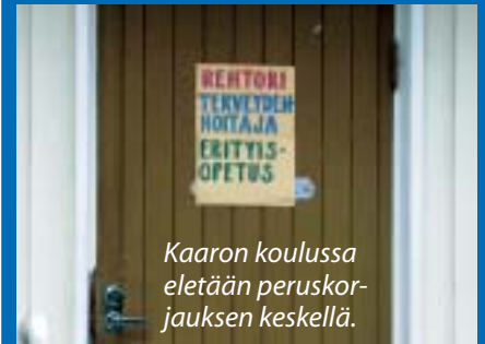
Kaaron koulussa eletään peruskorjauksen keskellä.