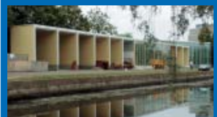
Uusi kirjasto avataan tammikuussa.

Suurimmat rakennustekniset muutokset tehtiin 1. kerroksessa. Hankkeen yhteydessä uusittiin rakennuksen eteläpuoleiset ulkoportaat ja maalattiin ulkoverhouspinnat, vesikate sekä ikkunat ja ovet. Lisäksi laulusalin jyrkän vesikaton katto- tiilet uusittiin.