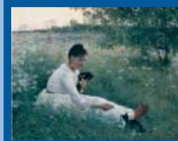
Elin Danielson-Gambogin maalaus Tyttö ja kissat kesäisessä maisemassa vuodelta 1892.

R auman Taidemuseon syksyn näyttelyohjelmassa komeilee UPM-Kymmenen taidekokoelmia esittelevä näyttely, johon on valittu 70 teosta yrityksen yli 2000 teoksen kokoelmasta. Raumalle esille tulevat teokset ovat pääasiassa suomalaista 1800-luvun lopun ja 1900-luvun alkupuoliskon maalaustaidetta. Kokonaisuuteen kuuluu maisemia, henkilökuvia, tehdasmiljöitä ja muotokuvia.